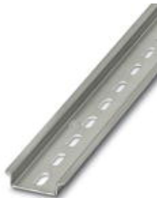
Szyna nośna, z otworami, Szerokość: 35 mm, Wysokość: 7,5 mm, Długość: 2000 mm, Kolor: srebrny

Należy pamiętać, że podane dane pochodzą z katalogu online. Proszę o pobranie kompletnych informacji i danych z dokumentacji użytkownika. Obowiązują ogólne warunki użytkowania dla materiałów pobieranych przez Internet. ( http://phoenixcontact.pl/download )