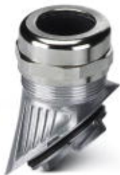
Metalowy przepust kablowy EVO z zamknięciem bagnetowym, seria B, rozmiar M40, średnica przewodu 19-27 mm

Należy pamiętać, że podane dane pochodzą z katalogu online. Proszę o pobranie kompletnych informacji i danych z dokumentacji użytkownika. Obowiązują ogólne warunki użytkowania dla materiałów pobieranych przez Internet. ( http://phoenixcontact.pl/download )