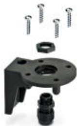
kątownik do montażu stopy, czarny

Należy pamiętać, że podane dane pochodzą z katalogu online. Proszę o pobranie kompletnych informacji i danych z dokumentacji użytkownika. Obowiązują ogólne warunki użytkowania dla materiałów pobieranych przez Internet. ( http://phoenixcontact.pl/download )