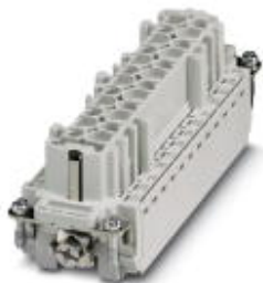
Wkładka styków żeńskich HEAVYCON, seria B24, 24-pinowa, do styki zaciskanych

Należy pamiętać, że podane dane pochodzą z katalogu online. Proszę o pobranie kompletnych informacji i danych z dokumentacji użytkownika. Obowiązują ogólne warunki użytkowania dla materiałów pobieranych przez Internet. ( http://phoenixcontact.pl/download )