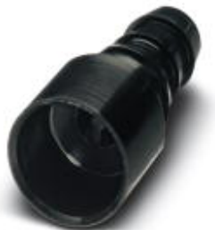
Gniazdo pneumatyczne, do modułu HC-M-PN2, wewnętrzna średnica węża 6,0 mm

Należy pamiętać, że podane dane pochodzą z katalogu online. Proszę o pobranie kompletnych informacji i danych z dokumentacji użytkownika. Obowiązują ogólne warunki użytkowania dla materiałów pobieranych przez Internet. ( http://phoenixcontact.pl/download )