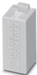
Moduł zaślepiający HEAVYCON, do wolnych gniazd w ramce modułów

Należy pamiętać, że podane dane pochodzą z katalogu online. Proszę o pobranie kompletnych informacji i danych z dokumentacji użytkownika. Obowiązują ogólne warunki użytkowania dla materiałów pobieranych przez Internet. ( http://phoenixcontact.pl/download )