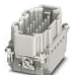
Wkładka męska HEAVYCON, seria B10, 10 + PE pinowa, złącze typu push-in