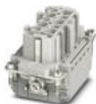
Wkładka żeńska HEAVYCON, seria B10, 10 + PE pinowa, złącze typu push-in