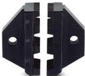
Matryca zapasowa do CRIMPFOX 25R

Należy pamiętać, że podane dane pochodzą z katalogu online. Proszę o pobranie kompletnych informacji i danych z dokumentacji użytkownika. Obowiązują ogólne warunki użytkowania dla materiałów pobieranych przez Internet. ( http://phoenixcontact.pl/download )