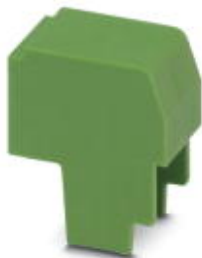
Zaślepki złączy do druku, do wolnych zacisków

Należy pamiętać, że podane dane pochodzą z katalogu online. Proszę o pobranie kompletnych informacji i danych z dokumentacji użytkownika. Obowiązują ogólne warunki użytkowania dla materiałów pobieranych przez Internet. ( http://phoenixcontact.pl/download )