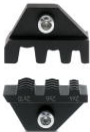
Matryca do automatu zaciskowego CF 500, do końcówek kabli TWIN (AI-TWIN...) 2 x 4, 2 x 6 i 2 x 10 mm 2

Należy pamiętać, że podane dane pochodzą z katalogu online. Proszę o pobranie kompletnych informacji i danych z dokumentacji użytkownika. Obowiązują ogólne warunki użytkowania dla materiałów pobieranych przez Internet. ( http://phoenixcontact.pl/download )