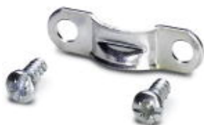
Obejma odciążająca naciąg

Należy pamiętać, że podane dane pochodzą z katalogu online. Proszę o pobranie kompletnych informacji i danych z dokumentacji użytkownika. Obowiązują ogólne warunki użytkowania dla materiałów pobieranych przez Internet. ( http://phoenixcontact.pl/download )