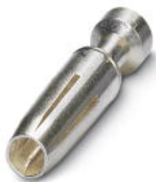
Toczony styk zaciskowy 2,5, pojedynczy styk żeński, przekrój żyły 1,5 mm 2 , posrebrzony

Należy pamiętać, że podane dane pochodzą z katalogu online. Proszę o pobranie kompletnych informacji i danych z dokumentacji użytkownika. Obowiązują ogólne warunki użytkowania dla materiałów pobieranych przez Internet. ( http://phoenixcontact.pl/download )