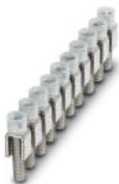
Mostek stały, Wymiar rastra: 6 mm, Liczba biegunów: 10, Kolor: srebrny

Należy pamiętać, że podane dane pochodzą z katalogu online. Proszę o pobranie kompletnych informacji i danych z dokumentacji użytkownika. Obowiązują ogólne warunki użytkowania dla materiałów pobieranych przez Internet. ( http://phoenixcontact.pl/download )