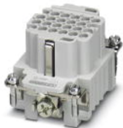
Wkładka styków żeńskich HEAVYCON serii DD24, 24-polowa, złącze zaciskowe

Należy pamiętać, że podane dane pochodzą z katalogu online. Proszę o pobranie kompletnych informacji i danych z dokumentacji użytkownika. Obowiązują ogólne warunki użytkowania dla materiałów pobieranych przez Internet. ( http://phoenixcontact.pl/download )