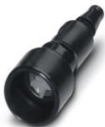
Gniazdo pneumatyczne z zaworem, do modułu HC-M-PN3, wewnętrzna średnica węża 3,0 mm

Należy pamiętać, że podane dane pochodzą z katalogu online. Proszę o pobranie kompletnych informacji i danych z dokumentacji użytkownika. Obowiązują ogólne warunki użytkowania dla materiałów pobieranych przez Internet. ( http://phoenixcontact.pl/download )