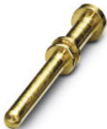
Styk zaciskany, toczone, Średnica styków: 2 mm, Przekrój końcówek: 0,75 mm 2 ...1,5 mm 2

Należy pamiętać, że podane dane pochodzą z katalogu online. Proszę o pobranie kompletnych informacji i danych z dokumentacji użytkownika. Obowiązują ogólne warunki użytkowania dla materiałów pobieranych przez Internet. ( http://phoenixcontact.pl/download )