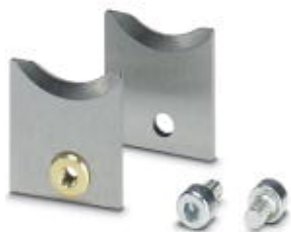
Nóż zapasowy, do automatu przycinającego CUTFOX 10

Należy pamiętać, że podane dane pochodzą z katalogu online. Proszę o pobranie kompletnych informacji i danych z dokumentacji użytkownika. Obowiązują ogólne warunki użytkowania dla materiałów pobieranych przez Internet. ( http://phoenixcontact.pl/download )