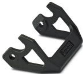
Klamra wzdluzna do obudowy B6, HC-EVO....AL i HC-STA....AL

Należy pamiętać, że podane dane pochodzą z katalogu online. Proszę o pobranie kompletnych informacji i danych z dokumentacji użytkownika. Obowiązują ogólne warunki użytkowania dla materiałów pobieranych przez Internet. ( http://phoenixcontact.pl/download )