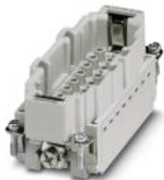
Wkładka styków męskich HEAVYCON, seria B16, 16-pinowa, do styków zaciskanych

Należy pamiętać, że podane dane pochodzą z katalogu online. Proszę o pobranie kompletnych informacji i danych z dokumentacji użytkownika. Obowiązują ogólne warunki użytkowania dla materiałów pobieranych przez Internet. ( http://phoenixcontact.pl/download )