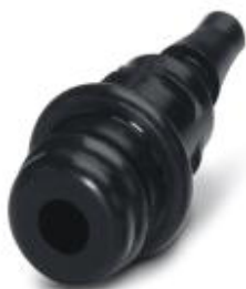
Wtyk pneumatyczny, do modułu HC-M-PN3, wewnętrzna średnica węża 3,0 mm

Należy pamiętać, że podane dane pochodzą z katalogu online. Proszę o pobranie kompletnych informacji i danych z dokumentacji użytkownika. Obowiązują ogólne warunki użytkowania dla materiałów pobieranych przez Internet. ( http://phoenixcontact.pl/download )