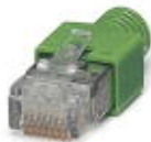
Rysunek przedstawia wariant FL PLUG RJ45 GN/2

Wtyk RJ45, ekranowany, z tulejką przeciwzgieciową, 2 sztuki, szara w przypadku kabli prostych, do przygotowania na miejscu. Zaleca się stosowanie zestawu wtyków z szarą tulejką przeciwzgieciową do połączeń nie krzyżujących się.