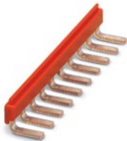
Mostek wtykany, Wymiar rastra: 6,15 mm, Liczba biegunów: 10, Kolor: czerwone

Należy pamiętać, że podane dane pochodzą z katalogu online. Proszę o pobranie kompletnych informacji i danych z dokumentacji użytkownika. Obowiązują ogólne warunki użytkowania dla materiałów pobieranych przez Internet. ( http://phoenixcontact.pl/download )