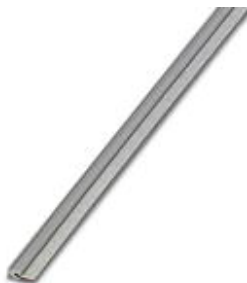
Mostki ciągłe, Długość: 500 mm, Kolor: szary

Należy pamiętać, że podane dane pochodzą z katalogu online. Proszę o pobranie kompletnych informacji i danych z dokumentacji użytkownika. Obowiązują ogólne warunki użytkowania dla materiałów pobieranych przez Internet. ( http://phoenixcontact.pl/download )