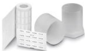
Rys. przedst. wersję produktu EML (20X8)R

Etykiety, Rolka, biały, nieopisane, opisywany przy pomocy: THERMOMARK ROLL, THERMOMARK ROLL X1, THERMOMARK X1.2, THERMOMARK S1.1, Rodzaj montażu: Klejenie, Wielkość pola opisowego: 24 x 4 mm