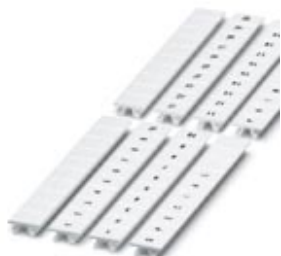
Taśma oznaczników, 10-częściowa, nadruk poprzeczny z kolejnymi liczbami: 31 ... 40, biały, Szerokość: 8 mm

Należy pamiętać, że podane dane pochodzą z katalogu online. Proszę o pobranie kompletnych informacji i danych z dokumentacji użytkownika. Obowiązują ogólne warunki użytkowania dla materiałów pobieranych przez Internet. ( http://phoenixcontact.pl/download )