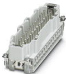
Wkładka styków męskich HEAVYCON, seria B24, 24-pinowa, nadruk 25 ... 48, zacisk śrubowy

Należy pamiętać, że podane dane pochodzą z katalogu online. Proszę o pobranie kompletnych informacji i danych z dokumentacji użytkownika. Obowiązują ogólne warunki użytkowania dla materiałów pobieranych przez Internet. ( http://phoenixcontact.pl/download )