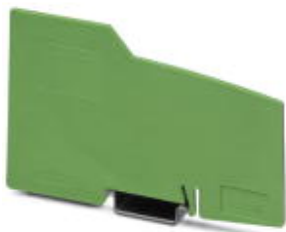
Pokrywa płytowa końcowa Inline

Należy pamiętać, że podane dane pochodzą z katalogu online. Proszę o pobranie kompletnych informacji i danych z dokumentacji użytkownika. Obowiązują ogólne warunki użytkowania dla materiałów pobieranych przez Internet. ( http://phoenixcontact.pl/download )