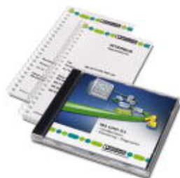
Oprogramowania konfiguracji sieci dla INTERBUS Generation 4

Należy pamiętać, że podane dane pochodzą z katalogu online. Proszę o pobranie kompletnych informacji i danych z dokumentacji użytkownika. Obowiązują ogólne warunki użytkowania dla materiałów pobieranych przez Internet. ( http://phoenixcontact.pl/download )