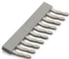
Mostek wtykany, Wymiar rastra: 5,2 mm, Liczba biegunów: 10, Kolor: szary

Należy pamiętać, że podane dane pochodzą z katalogu online. Proszę o pobranie kompletnych informacji i danych z dokumentacji użytkownika. Obowiązują ogólne warunki użytkowania dla materiałów pobieranych przez Internet. ( http://phoenixcontact.pl/download )