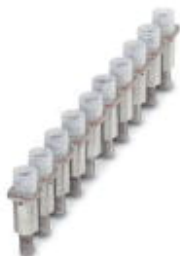
Mostek stały, Wymiar rastra: 8,2 mm, Liczba biegunów: 10, Kolor: srebrny

Należy pamiętać, że podane dane pochodzą z katalogu online. Proszę o pobranie kompletnych informacji i danych z dokumentacji użytkownika. Obowiązują ogólne warunki użytkowania dla materiałów pobieranych przez Internet. ( http://phoenixcontact.pl/download )