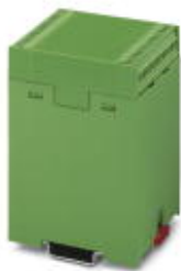
Podst. obud., ze stopą zatrząskową

Należy pamiętać, że podane dane pochodzą z katalogu online. Proszę o pobranie kompletnych informacji i danych z dokumentacji użytkownika. Obowiązują ogólne warunki użytkowania dla materiałów pobieranych przez Internet. ( http://phoenixcontact.pl/download )