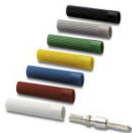
Tulejka izolująca, Kolor: zielony

Należy pamiętać, że podane dane pochodzą z katalogu online. Proszę o pobranie kompletnych informacji i danych z dokumentacji użytkownika. Obowiązują ogólne warunki użytkowania dla materiałów pobieranych przez Internet. ( http://phoenixcontact.pl/download )