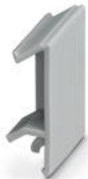
Zaślepka do wolnych zacisków, kolor: jasnoszary

Należy pamiętać, że podane dane pochodzą z katalogu online. Proszę o pobranie kompletnych informacji i danych z dokumentacji użytkownika. Obowiązują ogólne warunki użytkowania dla materiałów pobieranych przez Internet. ( http://phoenixcontact.pl/download )