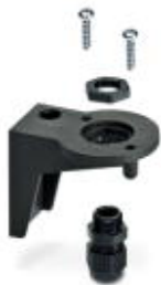
kątownik do montażu podłogowego, czarny

Należy pamiętać, że podane dane pochodzą z katalogu online. Proszę o pobranie kompletnych informacji i danych z dokumentacji użytkownika. Obowiązują ogólne warunki użytkowania dla materiałów pobieranych przez Internet. ( http://phoenixcontact.pl/download )