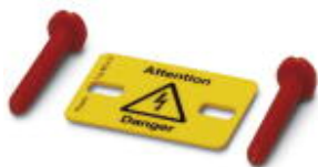
Rysunek przedstawia wariant WS 4-8

Etykieta ostrzegawcza, Płyta, pomarańczowy, opisany: Błyskawica i wskazówka ostrzegawcza po angielsku, Rodzaj montażu: Śruby, nity, do styków o szerokości: 15 mm