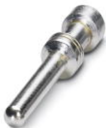
Toczony styk zaciskowy 2,5, pojedynczy styk męski, przekrój żyły 0,5 mm 2 , posrebrzony

Należy pamiętać, że podane dane pochodzą z katalogu online. Proszę o pobranie kompletnych informacji i danych z dokumentacji użytkownika. Obowiązują ogólne warunki użytkowania dla materiałów pobieranych przez Internet. ( http://phoenixcontact.pl/download )