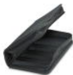
Etui na narzędzia, bez wyposażenia

Torba narzędziowa, bez wyposażenia - TOOL-KIT STANDARD EMPTY - 1212423