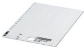
Rysunek przedstawia wariant produktu

Szyld z tworzywa sztucznego, Karta, żółty, nieopisane, opisywany przy pomocy: THERMOMARK PRIME, THERMOMARK CARD, Rodzaj montażu: Klejenie, Wielkość pola opisowego: 17 × 7 mm