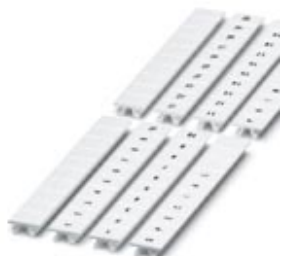
Taśma oznaczników, 10-częściowa, nadruk podłużny z kolejnymi liczbami: 1 ... 10, biały, Szerokość: 8 mm

Należy pamiętać, że podane dane pochodzą z katalogu online. Proszę o pobranie kompletnych informacji i danych z dokumentacji użytkownika. Obowiązują ogólne warunki użytkowania dla materiałów pobieranych przez Internet. ( http://phoenixcontact.pl/download )