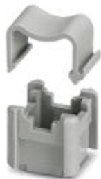
Podpórka do szyn zbiorczych

Należy pamiętać, że podane dane pochodzą z katalogu online. Proszę o pobranie kompletnych informacji i danych z dokumentacji użytkownika. Obowiązują ogólne warunki użytkowania dla materiałów pobieranych przez Internet. ( http://phoenixcontact.pl/download )