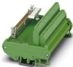
Moduł przejściowy VARIOFACE dla 32 kanałów

Należy pamiętać, że podane dane pochodzą z katalogu online. Proszę o pobranie kompletnych informacji i danych z dokumentacji użytkownika. Obowiązują ogólne warunki użytkowania dla materiałów pobieranych przez Internet. ( http://phoenixcontact.pl/download )