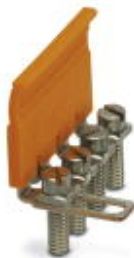
Mostek łączeniowy, Wymiar rastra: 8,2 mm, Liczba biegunów: 4, Kolor: srebrny

Należy pamiętać, że podane dane pochodzą z katalogu online. Proszę o pobranie kompletnych informacji i danych z dokumentacji użytkownika. Obowiązują ogólne warunki użytkowania dla materiałów pobieranych przez Internet. ( http://phoenixcontact.pl/download )