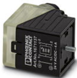
wtyk zaworowy, 3-polowy, typ A, 1 LED, z oprzewodowaniem ochronnym, złącze śrubowe, dławnica kablowa Pg9

Należy pamiętać, że podane dane pochodzą z katalogu online. Proszę o pobranie kompletnych informacji i danych z dokumentacji użytkownika. Obowiązują ogólne warunki użytkowania dla materiałów pobieranych przez Internet. ( http://phoenixcontact.pl/download )