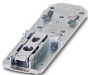
Uniwersalny adapter szyny nośnej

Należy pamiętać, że podane dane pochodzą z katalogu online. Proszę o pobranie kompletnych informacji i danych z dokumentacji użytkownika. Obowiązują ogólne warunki użytkowania dla materiałów pobieranych przez Internet. ( http://phoenixcontact.pl/download )