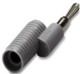
Wtyczki redukujące, Kolor: szary

Należy pamiętać, że podane dane pochodzą z katalogu online. Proszę o pobranie kompletnych informacji i danych z dokumentacji użytkownika. Obowiązują ogólne warunki użytkowania dla materiałów pobieranych przez Internet. ( http://phoenixcontact.pl/download )