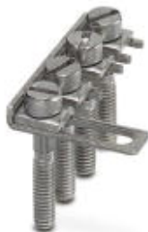
Mostek łączeniowy, Wymiar rastra: 8,2 mm, Liczba biegunów: 4, Kolor: srebrny

Należy pamiętać, że podane dane pochodzą z katalogu online. Proszę o pobranie kompletnych informacji i danych z dokumentacji użytkownika. Obowiązują ogólne warunki użytkowania dla materiałów pobieranych przez Internet. ( http://phoenixcontact.pl/download )