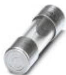
Akcesoria do automatu zacisk.

Narzędzie do cięcia kabli - CF-10 FUSE 120V SET - 1207323